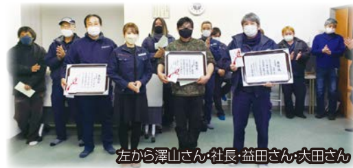
左から澤山さん・社長・益田さん・大田さん